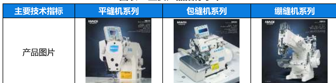
图表 5 主要产品指标水平

公司主营业务缝纫机产品的性能对顾客的需求和期望是至关重要的。美机每年不断增加技术投入，产品性能逐年提升，在采用国际标准的同时，不断缩小与国际标杆的技术差距。