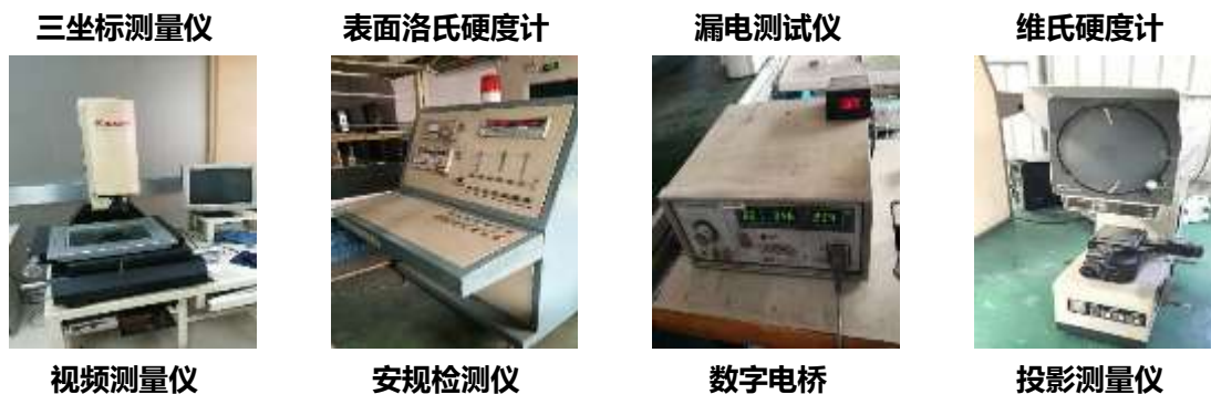
图表 4 公司检测设备（部分）