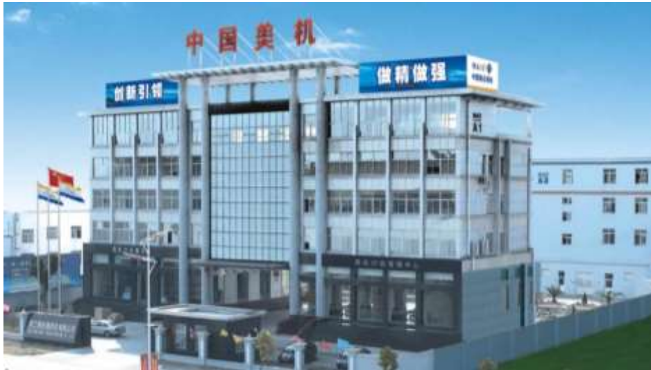
图表1 浙江美机缝纫机有限公司厂区概况

浙江美机缝纫机有限公司座落于“中国缝制之都”的台州温岭市，是中国领先的缝制机械机电一体化整体解决方案优秀提供商。公司主营平缝、包缝、绷缝、曲折缝、特种机、自动缝制单元等六大系列100多种品种，倡导“机电一体化”，为制衣、制帽、制包、制鞋等行业提供技术设备及解决方案服务。公司年生产能力达到40万台工业缝纫机，拥有世界上先进的检测设备和各种加工设备。自1995年成立以来，美机从一家作坊式小厂逐步发展成为中国乃至世界重要的缝制机械研发和生产基地、缝制机械“电脑车专家、机电一体化领先品牌”，成功跻身缝纫机行业前列。